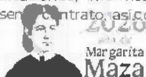
2026 Margarita Maza

SEXTA. CONFIDENCIALIDAD Y DATOS PERSONALES. "LA PRESTADORA DE SERVICIOS" se obliga a mantener estricta confidencialidad evitando divulgar a terceras personas por medio de publicaciones, informes o cualquier otro medio, las actividades que desarrolla con motivo del presente contrato, así como los datos y resultados que obtenga con motivo de la prestación de